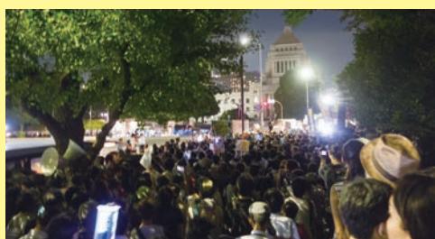
国会前には若者たちを始め多くの市民が、私も参加しています。

隣接遊休地と50億円かけて最新の耐震化を行った現庁舎を使えば、移転新築費の1/4以下で「タコ足」を解消できます。